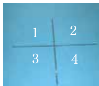
各ポジションの位置