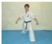
前屈立ち蹴りの構え